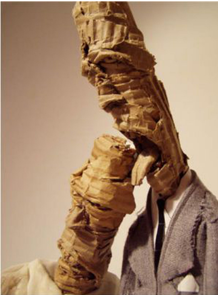
'La Boda' (2008), de Montes López

Las obras tienen como hilo conductor diferentes temas: el amor ( La boda , 2008, de Montes López), la muerte ( RUINAS , 2011, de Cristina Lama), las creencias ( Las ideologías encadenan al espíritu , 2009, o Adorando al becerro tecnológico , 2009, ambos cuadros de Guillermo Pérez Villalta), la manifestación del dolor ( Lamento I y II , 2005, de Aaron Lloyd), retratos ( 9 fotos de carnet, (años 50) , 2012, de Luis Gordillo) o paisajes o lugares ( Where are we going? London (1/3) , 2009, de Owanto o Derribo (HMS Victory) , 2005, de Chema Cobo).