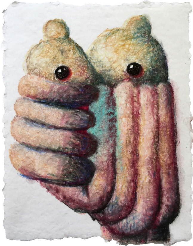
Mie Yim, “#67” (2020), pastel en papel Shizen, 11 x 8.5 pulgadas

Una lágrima roja cuelga del vértice del paralelogramo. Dos orejas difusas de color azul y turquesa apuntan hacia arriba, mientras que la cabeza rosada está conectada directamente a un grupo de protuberancias rosadas rechonchas.