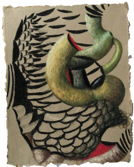
Mie Yim, "#105" (2020), pastel sobre papel Shizen, 11 x 8.5 pulgadas

Las restricciones entran en vigor el domingo por la noche a las 8 p.m. y se cerrarán todos los negocios no esenciales en todo el estado, dejando abiertas solo tiendas de comestibles, farmacias y otras operaciones esenciales. Todas las actividades al aire libre no solitarias, como el baloncesto y otros deportes de equipo, también están prohibidas.