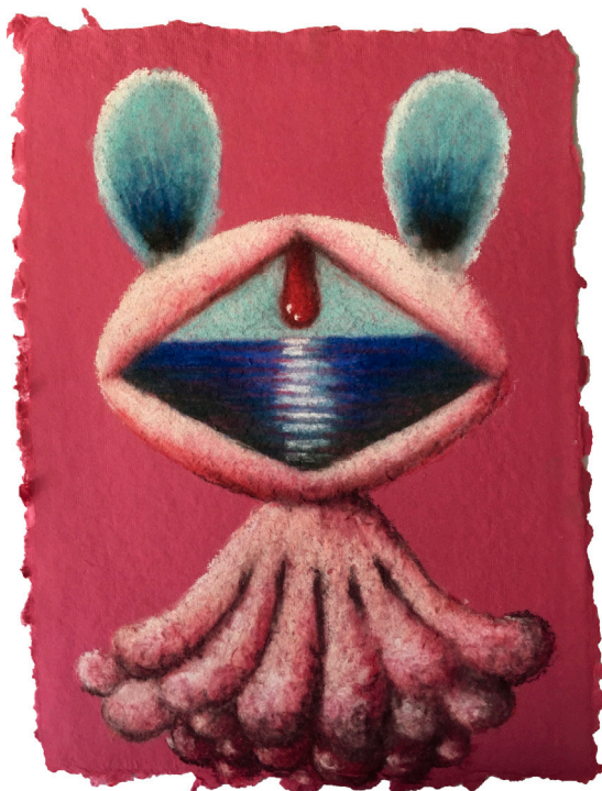
Mie Yim, "#77" (2020), pastel sobre papel Shizen, 11 x 8.5 pulgadas

En sus docenas de pasteles sobre papel hecho a mano, Mie Yim parece empezar de nuevo cada uno, sin intentar nunca variar sobre un tema.